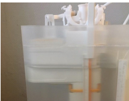
↑ FOR LAV