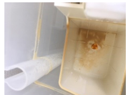
↑ SVØMMER MED KALK